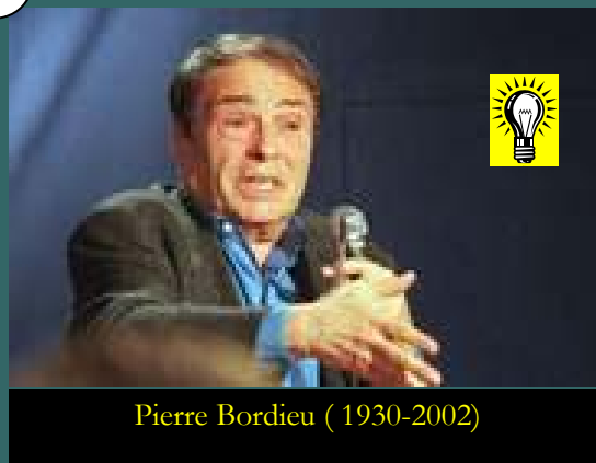
Pierre Bourdieu ( 1930-2002)

Trate de plantear y/o identificar algunas de las rupturas epistemológicas dadas a continuación 1