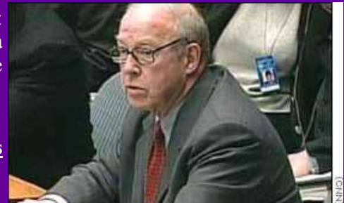
Hans Blix, en momentos que denuncia la ausencia de armas de destrucción masiva en Irak (Agencia Internacional de Energía Atómica)

Existen visiones encontradas respecto a S-11, para lo cual vamos a utilizar algunos de los Artículos publicados por los medios de comunicación.